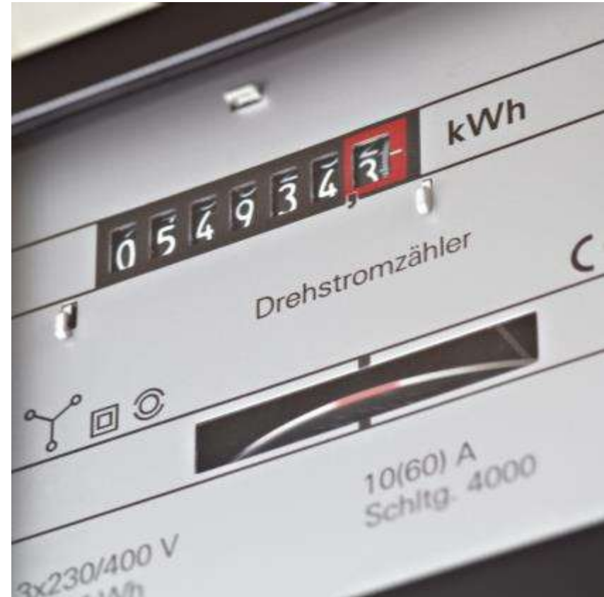
Umsetzungsanreiz ab 50'000 kWh