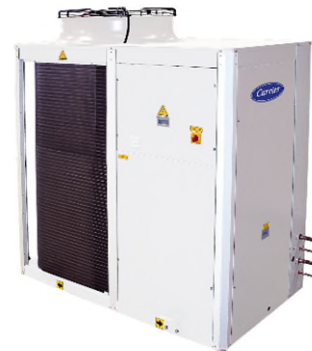
Kühlaggregat 25kW Carrier www.carrier.com

Einsparung und Förderbeitrag: Der Ersatz des Kühlaggregates reduziert den Energieverbrauch beim Kühlen oder beim Heizen im Weinkeller um bis zu 50%. Der Förderbeitrag deckt rund 15-20% der Investitionskosten (siehe Tabelle Beispielbetrieb).