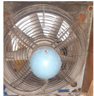
Alter Lüfter Weinkellerei

Umsetzung der Massnahme: Der Ersatz der Ventilatoren muss durch eine Fachperson für industrielle Belüftung erfolgen. Dabei ist wichtig, aus Sicherheitsgründen (CO 2 -Absaugung) die benötigte Zuluftmenge einzuhalten.