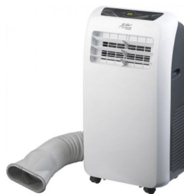
umkehrbare Klimaanlage

Wichtig ist, dass die kalte Luft der Klimaanlage nach aussen (oder einen anderen Raum) geführt wird.