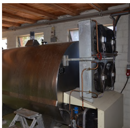
Groupe froid et cuve de lait

Mise en œuvre de la solution : L'installation d'un groupe froid doit être réalisée par un frigoriste ou un installateur de matériel de traite.