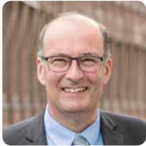
Markus Ritter Präsident Schweizer Bauernverband

«Erneuerbare Energien, Energie- effizienz und Klima- schutz sind für die Landwirtschaft ein Gewinn. AgroCleanTech zeigt Landwirten, wie sie diese Chancen sinnvoll nutzen können.»